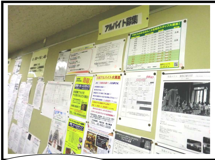
校内アルバイト求人情報 掲示板