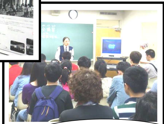
学内での大手スーパーマーケット アルバイト説明会・面接